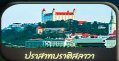
ปราสาทบราติสลาว่า

02-09 เม.ย. 69 / 03-10 เม.ย. 69 08-15 เม.ย. 69 / 10-17 เม.ย. 69 28 เม.ย. - 05 พ.ค. 69