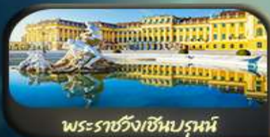
พระราชวังเชินบรุนน์