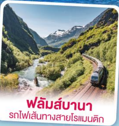
พลิမ်ส์บานา รถไฟเส้นทางสายโรแมนติก