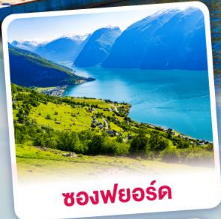
ช่องฟยอร์ด