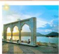
Ana Sagar Lake