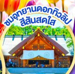
ชมอุทยานดอกทิวลิป สีแสนสดใส