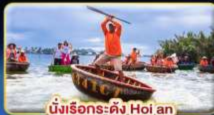
นั่งเรือระดั่ง Hoi an