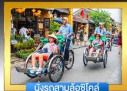
นั่งรถสามล้อซีโคล์