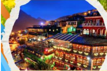
หมู่บ้านโบราณฉิวเฟิง