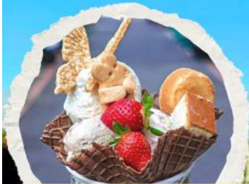
ร้าน ไอศกรีมมิยาซาร่า