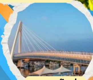
สะพานตงสู่ย