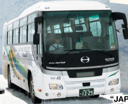
“JAPAN ALPINE ROUTE”