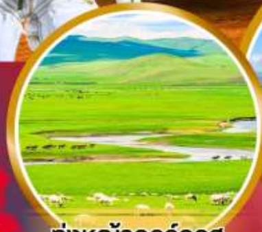
ทุ่งหญ้าออร์โดส