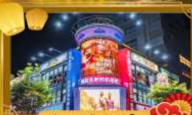
ช้อปปิ้งในยามค่ำคืน