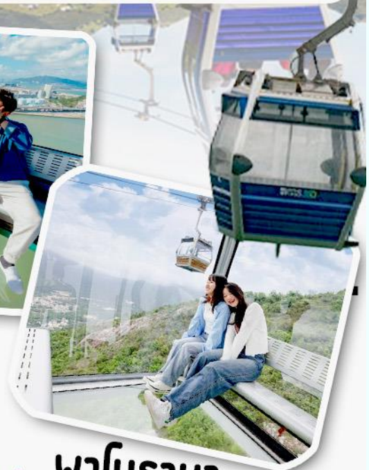
พานิราม่า