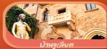
บ้านลูเลียงต