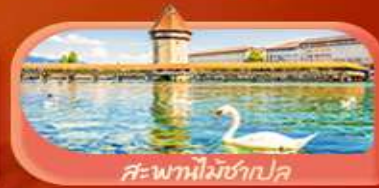
สะพานไมซ์ฮอป

Highlight เยือนหมู่บ้านแสนสวยเซอร์แมท เช็กอินศาลาไทยสุดงามที่โลซาน เที่ยวลูเซิร์น ชมสะพานไม้ชาเปลและอนุสาวรีย์สิงโต ซาลิ แอปสทิน ชมประติมากรรม The Fork และปราสาทซิลลองริมทะเลสาบ เยือนมิลาน มหาวิหารดูโอโม เที่ยวเวนิส เมืองลอยน้ำสุดโรแมนติก อินกับรักอมตะที่บ้านจูเลียต และช้อปปิ้งจุใจที่ Serravalle Outlet