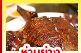
ห่านย่าง