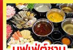
บุฟเฟ่ต์ซาบู