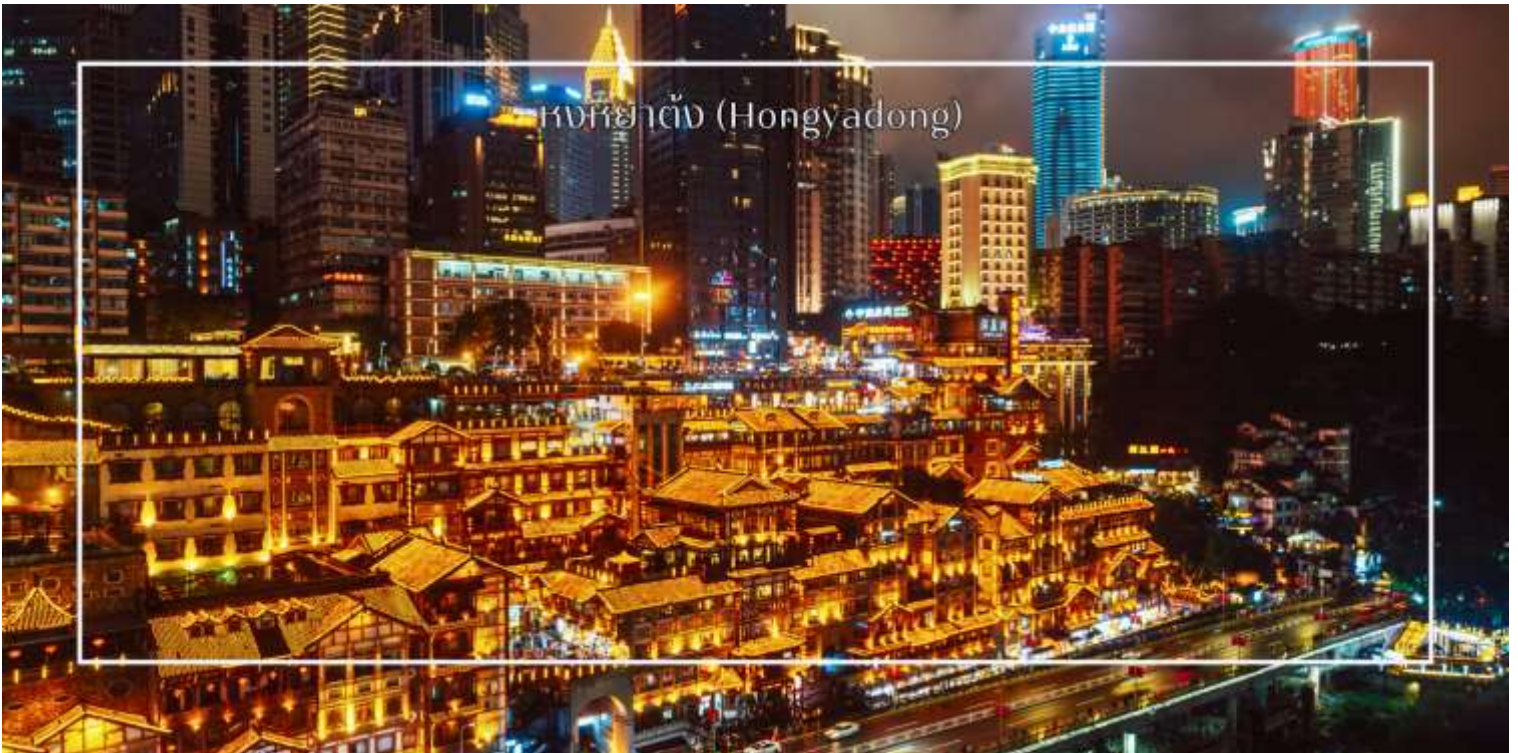
หงหยาดัง (Hongyadong)

จากนั้นเดินทางไปยัง ตลาดหงหยาดัง (Hongyadong) หรือที่เรียกว่า "Hongya Cave" เป็นสถานที่ท่องเที่ยวที่มีชื่อเสียงในเมืองฉงชิ่ง โดยตั้งอยู่ริมแม่น้ำแยงซี มีบรรยากาศที่เต็มไปด้วยวัฒนธรรมและประวัติศาสตร์ ตลาดหงหยาดังเป็นพื้นที่ที่มีอาคารแบบดั้งเดิมที่สร้างขึ้นในสไตล์สถาปัตยกรรมแบบซิโน-ทิเบต โดยมีร้านค้า ร้านอาหาร และบาร์จำนวนมาก ที่นี่ท่านสามารถลิ้มลองอาหารรสเด็ดและชมพื้นเมืองอื่นๆที่ขึ้นชื่อ ตลาดหงหยาดังยังมีวิวทิวทัศน์ที่สวยงามสามารถเดินเล่นตามทางเดินที่มีการจัดแสดงงานศิลปะและสินค้าท้องถิ่น