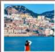
หาดซาโจ่วไฮ่

หอออกกาลเวศา • ชายหาดจินซา • รูปปั้นปลาวาฬ • ประตูเขินฮันทะเล สวนเหมียนโกซาน • ถนนโบราณเตาหยาง • WEI HAI WINDOW • ถนนฮิวจวีเป่า เรือบลูวิส • ย่านฮั่นเสอฝาง • หาดทรายซาโจ่วไฮ่ • ถนนหลงเจียง พิพิธภัณฑ์ที่ว่าการเก่าเยอรมัน • สะพานข้ามเจียว • ถนนจงซาน โบสถ์ St. Emil • หาดโซเบอร์ NO.3 • สวนจงซาน • ป่าด้ากวน QINGDAO HAITIAN CENTER ชั้น81 • ถนนเทียนซางหวาดปิ่นใหญ่จันเต่า โรงงานเบียร์ชิงเต่า • ถนนกมตันโก่ตง • ศูนย์เรือใบโอสัมปัท