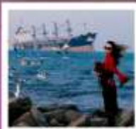
เขื่อนซูวิศ

ทัวร์คุณธรรม ไม่ลงร้านช้อปปิ้ง ไม่ขายออฟชั่น