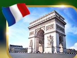
ประตูชัยฝรั่งเศส ปารีส