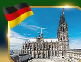
มหาวิหารแห่งเมืองโคโลญ