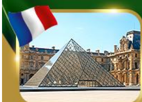
พีระมิดที่ลูฟวร์ ปารีส