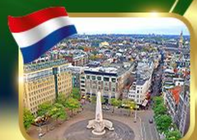
จัตุรัสดีนสแควร์ อัมสเตอร์ดัม