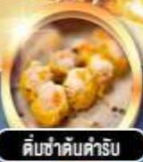
ติ่มซำคัมค้ำริบ