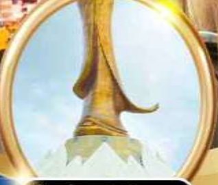
เจ้าแม่กวนอิมริมทะเล