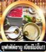
บุฟเฟ่ต์ชาบู มีอริมีอีน!!