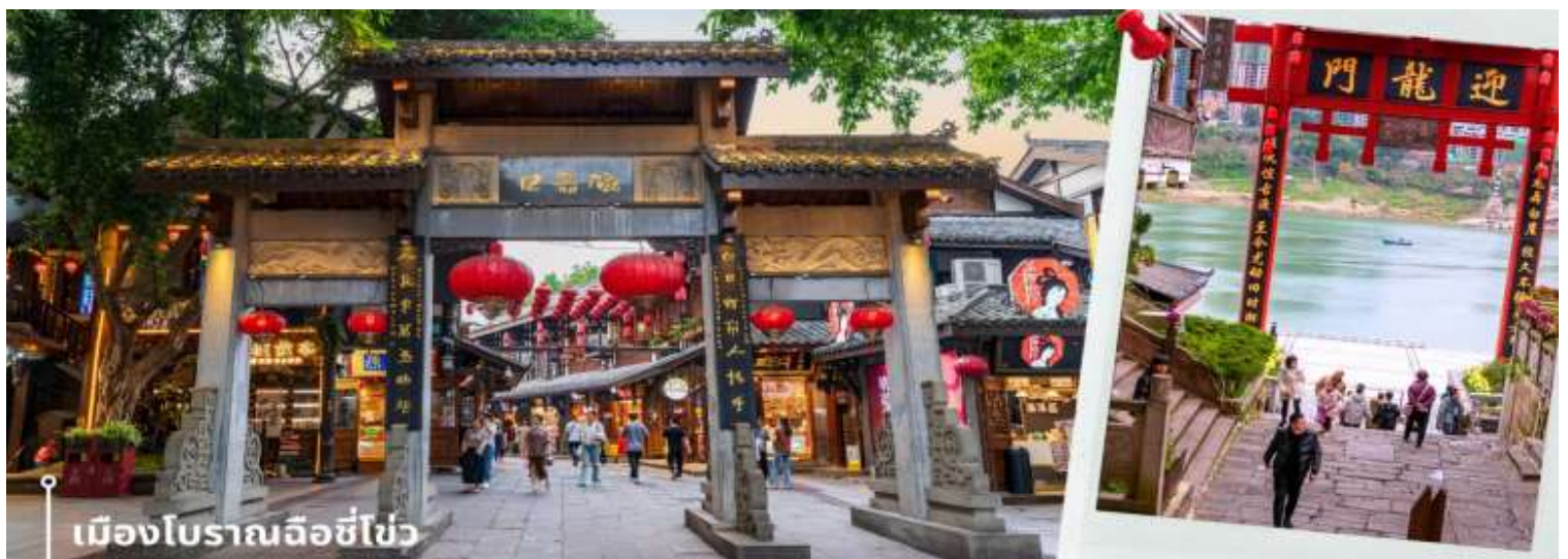
เมืองโบราณฉือชิว

หลังจากนั้นนำทุกท่านเดินทางสู่ เมืองโบราณฉือชิว เมืองโบราณและสถานที่ท่องเที่ยวชื่อดังในมณฑลฉงชิ่ง ประเทศจีน ที่อนุรักษ์สถาปัตยกรรมและวิถีชีวิตดั้งเดิมไว้และได้เป็นสถานที่ท่องเที่ยวระดับ 4A ของจีน ประวัติศาสตร์ยาวนาน มีลักษณะคล้ายตลาดเก่าโบราณริมแม่น้ำเจียหลิง เป็นแหล่งรวมของขนม ของกินพื้นเมือง ของฝาก รวมถึงมีวัดและร้านค้ามากมาย ให้ความรู้สึกเหมือนได้ย้อนเวลากลับไปในอดีต ภายในพื้นที่เต็มไปด้วยร้านค้าเก่าแก่ที่ขายทั้งอาหารพื้นเมือง ของกิน และของฝากมากมาย ทั้งยังมีการแสดงวัฒนธรรมพื้นบ้านให้นักท่องเที่ยวได้ชม ให้ความรู้สึกเหมือนหลุดเข้าไปในซีรีส์จีนย้อนยุค ที่เที่ยวฉงชิ่ง ที่เหมาะแก่การมาเดินเที่ยว ชิมอาหาร ถ่ายรูป และสัมผัสวิถีชีวิตแบบดั้งเดิมของชาวฉงชิ่งอย่างใกล้ชิดในบรรยากาศที่แสนสบาย