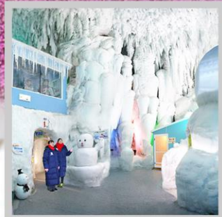
“KAMIKAWA ICE PAVILLION”