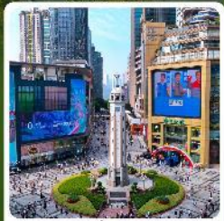
ถนนเจียฟางเป่ย์