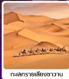
ทะเลทรายสีงาชวาน