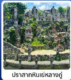
ปราสาทหินเย่หลางกู่

● ไฮไลท์ น้ำตกหวงกั๋วซู่ น้ำตกที่ใหญ่ที่สุดของจีน แหล่งท่องเที่ยวระดับ 5A ชมความสวยงาม หมู่บ้านวูเจียงจ้าย หมู่บ้านจีนโบราณ