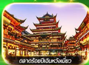
ตลาดร้อยปีเงินหวังเหมียว