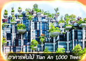
อาคารพันไม้ Tian An 1,000 Trees