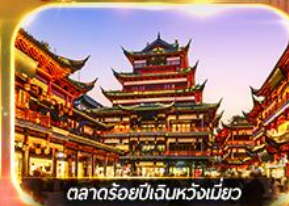
ตลาดร้อยปีเงินหวงเหมียว

เที่ยวดิสนีย์แลนด์เต็มวัน (รวมบัตร + รถรับส่ง)