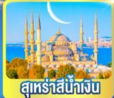
สุร่าย่านน้ำเงิน