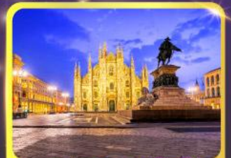
มหาวิหารคูโอโม