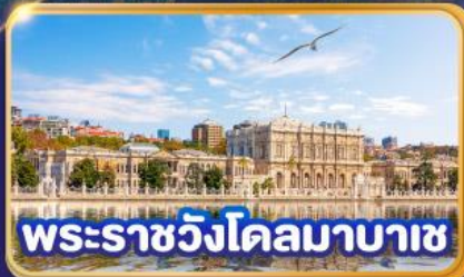
พระราชวังโดลมาบาซ