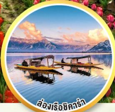
ล่องเรือชิคร่า