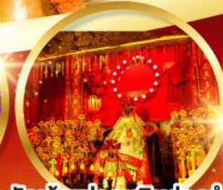
วัดเจ้าแม่กวนอิมฮองฮำ