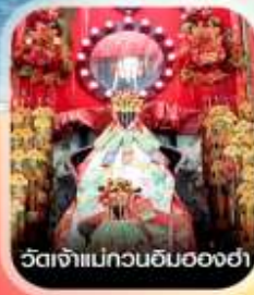
วัดเจ้าแม่กวนอิมของฮ่า

คอนเฟิร์มออกเดินทาง ทุกพีเรียด 2 ท่านขึ้นไป