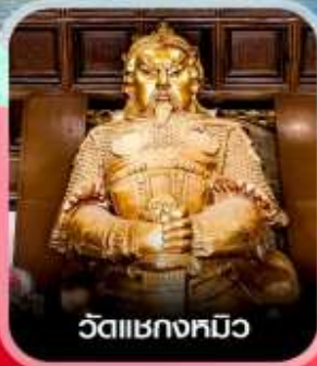
วัดเซกตม๊ิว