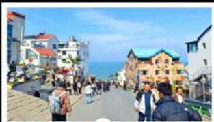
ถนนคอปเปลิ่งตามาหมายเลข 8

สัมผัสความยิ่งใหญ่ของ 4 เมืองสำคัญ ชิงเต่า - เยียนโก - ผิงไห่ - เว่ยไห่ ปาต้ากวน - โบสถ์คาทอลิก - ตึกเก่าริมหา