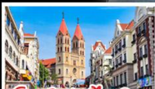
โบสถ์เซ็นต์ตีมาเดิล