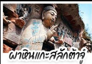
พาคินแกะสลักต้าจู่

10 - 14 มิ.ย. 69 20,888 13 - 17 มิ.ย. 69 20,888 17 - 21 มิ.ย. 69 20,888 20 - 24 มิ.ย. 69 20,888 22 - 26 มิ.ย. 69 20,888 24 - 28 มิ.ย. 69 20,888 26 มิ.ย. - 01 ก.ค. 69 20,888