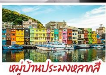
หมู่บ้านประมงเหลากาสี