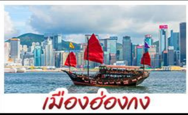
เมืองฮ่อทง

เมืองเก่าชิงเต่า - วิวเมืองฮ่อทง โรงเบียร์ชิงเต่า - ทำเรือชาวประมงเยียนโก