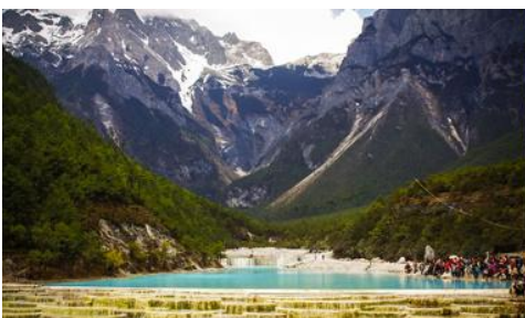
อุทยานไป๋ส่วยเหอ (หุบเขาพระจันทร์สีน้ำเงิน)

หมายเหตุ กรณีที่กระเช้าขึ้นภูเขาหิมะมังกรหยกปิดให้บริการ ด้วยเหตุที่สภาพอากาศไม่เอื้ออำนวย หรือเป็นการปิดเพื่อตรวจสอบสภาพและซ่อมแซมประจำปี ทางทัวร์ขอสงวนสิทธิ์ที่จะจัดโปรแกรมขึ้นกระเช้า ที่จุดชมวิวภูเขาหิมะมังกรหยก ณ สถานีกระเช้าหยุนชานผิงแทน