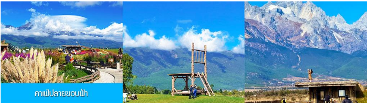
คาเฟ่ปลายขอบฟ้า

เที่ยง รับประทานอาหารกลางวัน ณ ภัตตาคาร (2)