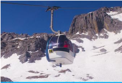
ภูเขาหิมะมังกรหยก (น้ำกระช้ำใหญ่)