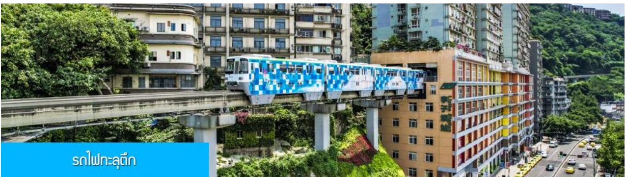
รถไฟทะลุตึก