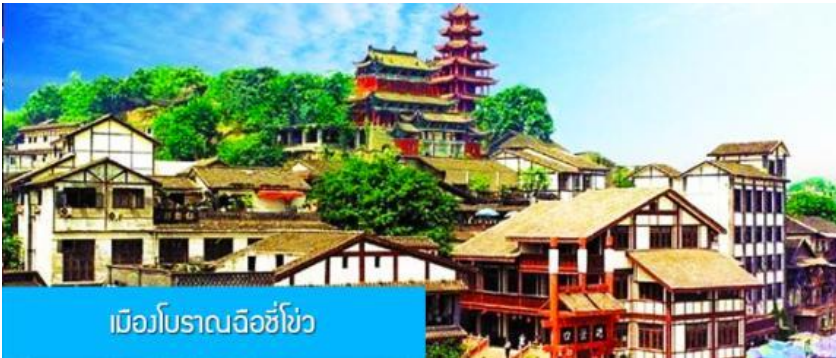
เมืองโบราณฉือชิว

พักที่ HOLIDAY INN EXPRESS HOTEL โรงแรมระดับ 4 ดาวหรือเทียบเท่าในเมืองจิว