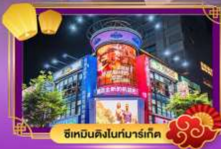
ซีเหมินดิงไนท์มาร์เก็ต