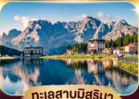
ทะเลสาบมึสุรีนา