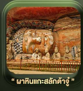
“ พาทินแคะสลักต้าจู่ ”

T2G-CKG26CZ Special of Chongqing... ซึ่ง อุโมงค์ ต้าจู่ อุโมงค์ หลุมฟ้า เขานางฟ้า 5D 3N (CZ)