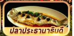
ปลาประรานาภิรมดี