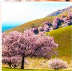
ทุ่งดอกอัลมอนด์