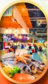
ตลาดปลาโงโง