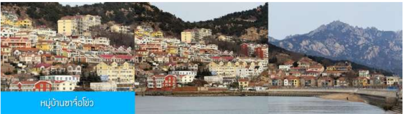
หมู่บ้านซาจื่อโขว

เที่ยง รับประทานอาหารกลางวัน ณ ภัตตาคาร (มื้อที่ 7)