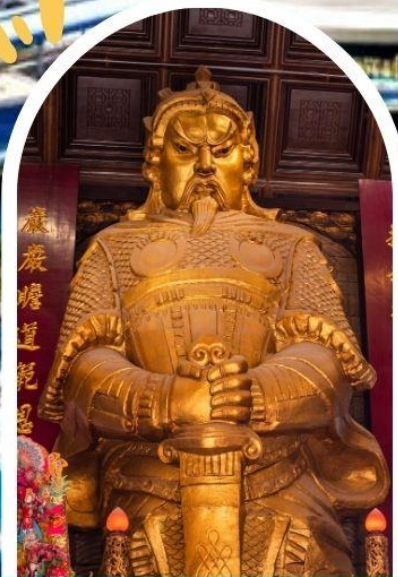
วัดแซกง ขอพรโชคลาก การเงิน และธุรกิจ