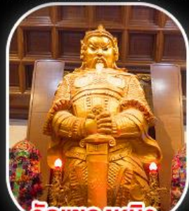
วัดเขกหมิว

วัดเขกหมิว- วัดเจ้าแม่กวนอิมฮ่องกง พระใหญ่ไผ่หลิน + กระเช้าเองปีง เมนูสุดพิเศษ!! ทิมซ่าฮ่องกง บุฟเฟ่ต์ชาบูสโตร์ฮ่องกง และห่านย่าง อิสระท่องเที่ยวดิสนีย์แลนด์ 1 วัน เลือกซื้อบัตรดิสนีย์แลนด์หรือซ้อปปีงจุใจ