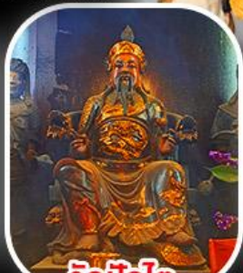
วัดบิกโต