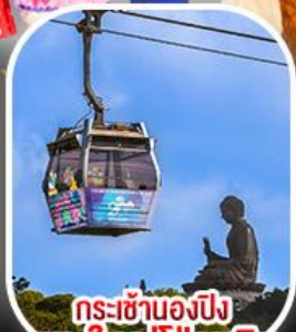
กระเช้าเองปีง พระใหญ่ไผ่หลิน