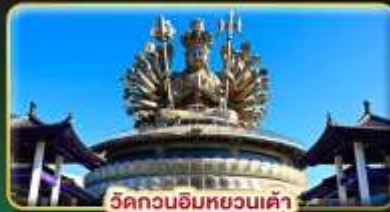
วัดกวนอิมหยวนเต้า