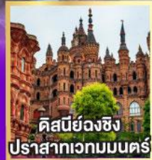
คิสนีย่งฉิ่ง ปราสาทเวกมณฑล