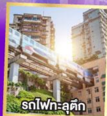
สทไฟฯ-ลู่ตึก

เที่ยวเต็มอิ่ม..ไม่ลงร้านช้อปปิ้ง นั่งรถไฟความเร็วสูง 2 เที่ยว ไม่มีออฟชั่นเพิ่ม