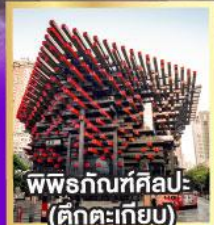
พิพิธภัณฑ์ศิลปะ (ตึกตะเกียบ)