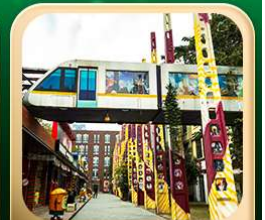
“ตงเจียวจื่อ”