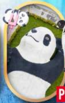
แพนด้าเซลฟี