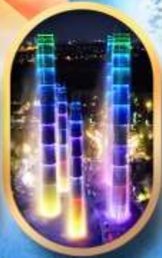
SKP Global Center