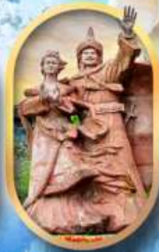
เมืองโบราณซงฟา