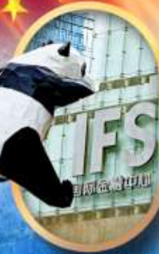
IFS หมีแพนด้าป็นตึก