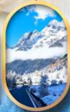
อุทยานสี่ครุณี