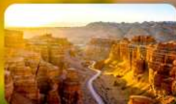
Charyn Canyon+Black Canyon