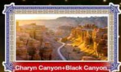
Charyn Canyon+Black Canyon