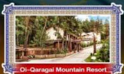
Oi-Qaragai Mountain Resort