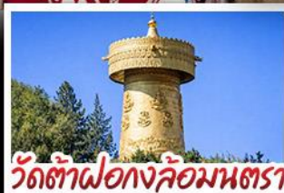
วัดต้าฝอ กงล้อมณฑล