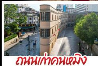
ถนนเก่าคุณหมิง